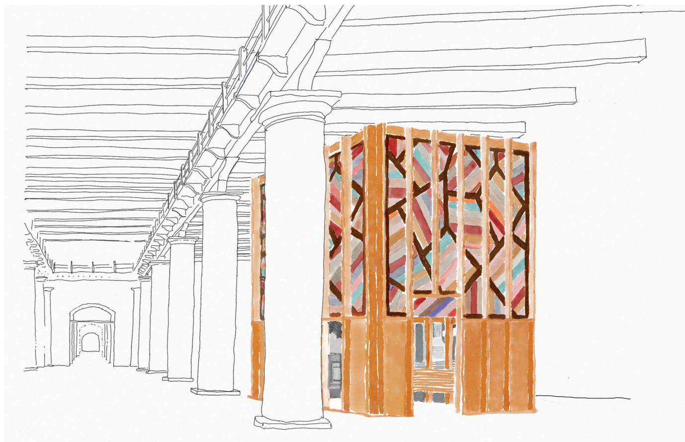
vista dell'installazione © Sauerbruch Hutton