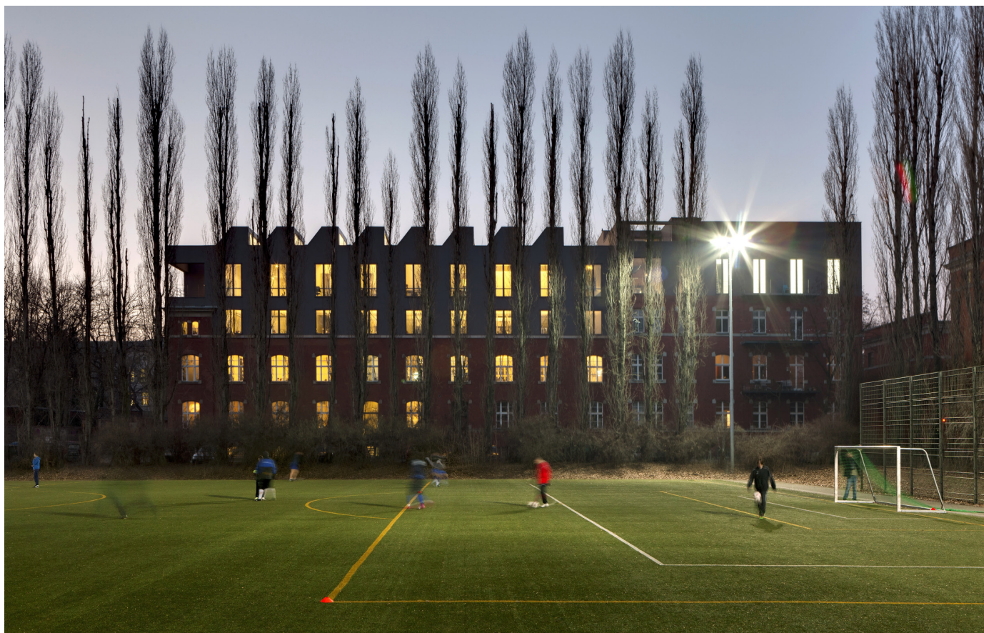
studio Sauerbruch Hutton a Berlino