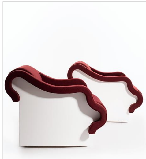
Ettore Sottsass, Sesselpaar Poupouf , um 1970, Edition Poltronova , Schätzpreis: 8 000 - 12 000 € / 9 200 - 18 000 $