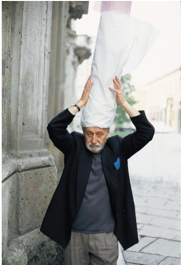
Ettore Sottsass