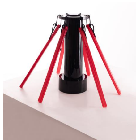
Ettore Sottsass, Vase « Cozek », 2006, Edition Manufacture nationale de Sèvres, CIRVA, Schätzpreis: 12 000 – 16 000 € / 14 000 – 19 000 $