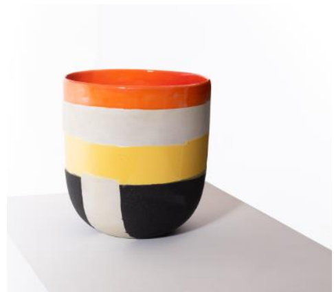
Ettore Sottsass, seltene Keramik, 1959, Biskuitporzellan und polychrome Glasur, vorgestellt bei der ersten Ausstellung von Ettore Sottsass in der Mailänder Galerie Il Sestante, Schätzpreis: 35 000 – 45 000 € / 41 000 – 53 000 $