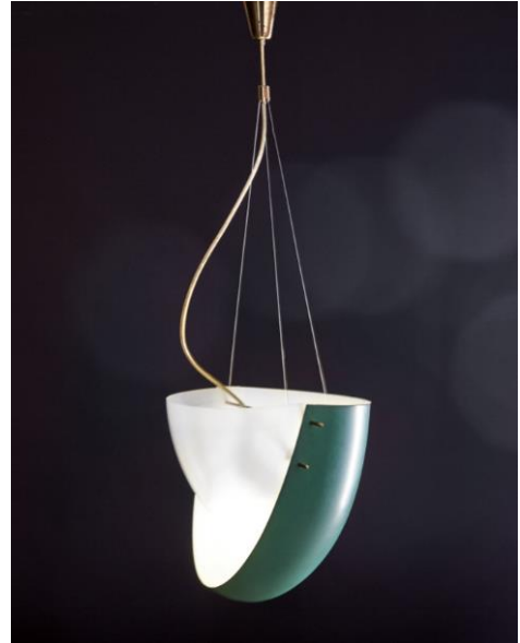
Ettore Sottsass, seltene Hängelampe Arredoluce , 1957, Schätzpreis: 50 000 € - 70 000 € / 57 500 - 80 500 $

Ebenfalls zu Beginn der 1970er Jahre geht Ettore Sottsass eine Verbindung mit einer weiteren italienischen Lampenmarke ein, Stilnovo . Für diese entwirft er die eigentümliche Deckenlampe Manifesto . Sie besteht aus einem in zwei Größen existierenden verchromten Stahlrohr, an dessen Ende eine Metallkugel die Lichtquelle kaschiert. Für Sottsass geht es darum, dem Mobiliar einen architektonischen Charakter zu verleihen und den Raum durch die Kreation leuchtender Stalaktiten zu modellieren.