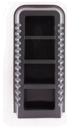
Ettore Sottsass, seltenes Bücherregal aus der Serie Mobili Grigi , um 1970, Edition Poltronova , Schätzpreis: 25 000 - 35 000 € / 29 300 - 41 000 $