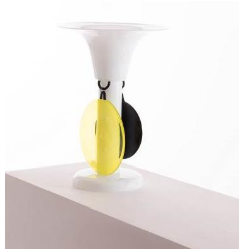
Ettore Sottsass, Kelch Sapho , 1986, Edition Toso vetri d'arte für Memphis, Schätzpreis: 3 000 – 5 000 € / 3 450 – 5 750 $

Parallel zu seiner ersten Ausstellung in einem französischen Museum, 1994 im Centre Pompidou, wird Sottsass von der Manufacture de Sèvres eingeladen. Er kreiert dort 14 außerordentlich originelle Stücke, indem er – seiner Gewohnheit entsprechend – das traditionelle Können dieser staatlichen Manufaktur bis an ihre Grenzen herausfordert. Repertorio Sottsass präsentiert zwei der aus der Zusammenarbeit zwischen Sottsass und der Manufacture de Sèvres hervorgegangenen Stücke, darunter eine Vase Cozek , die 2006 während einer erneuten Residenz des Künstlers entstanden ist (Schätzpreis: 12 000 – 16 000 € / 14 000 – 19 000 $).